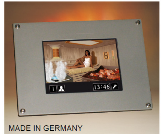
MADE IN GERMANY